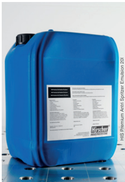
HIS Premium Anti Spritzer Emulsion 20l

zusätzlich erhalten Sie zum Aktionspaket 3D noch: » 1 Stück HIS28MK Masseanschluss für 28mm System