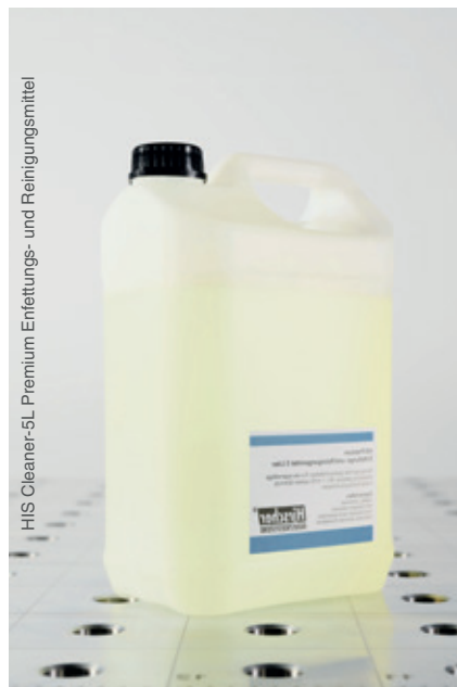
HIS Cleaner-5L Premium Entfettungs- und Reinigungsmittel

Reinigungsbürste Nylon, Brennerhalter und Masseanschluss nicht abgebildet.