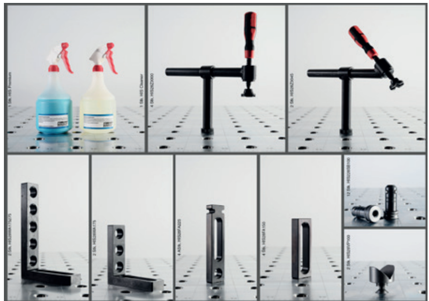
Bilder entsprechen nicht den realen Größenunterschieden